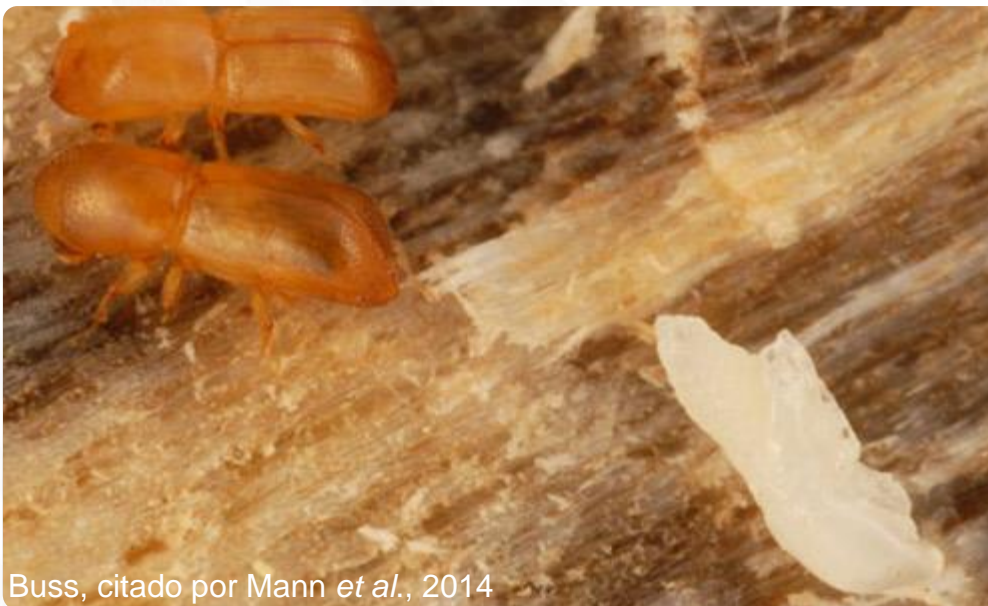
Buss, citado por Mann et al. , 2014

Dos escarabajos recién emergidos (exoesqueleto todavía en oscurecimiento) cerca de una pupa blanca de la que el adulto aún no ha emergido.