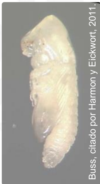
Buss, citado por Harmon y Eickwort, 2011.

Las pupas se encuentran en las galerías, son de color blanco cuando esta inmadura y ámbar cuando madura. Con tamaño aproximado de 2.5 mm. Se le llama pupa libre (exarata), puesto que las distintas partes del cuerpo se reconocen con facilidad; las antenas, piezas bucales, patas y alas se encuentran libres o sueltas.